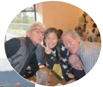
刀根大士会員 お孫さんと