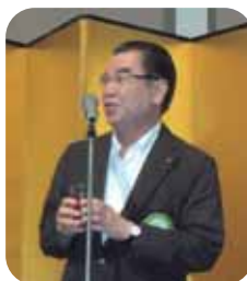
栗田会員乾杯挨拶