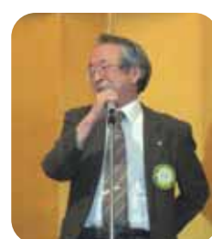
竹内会員中締め挨拶